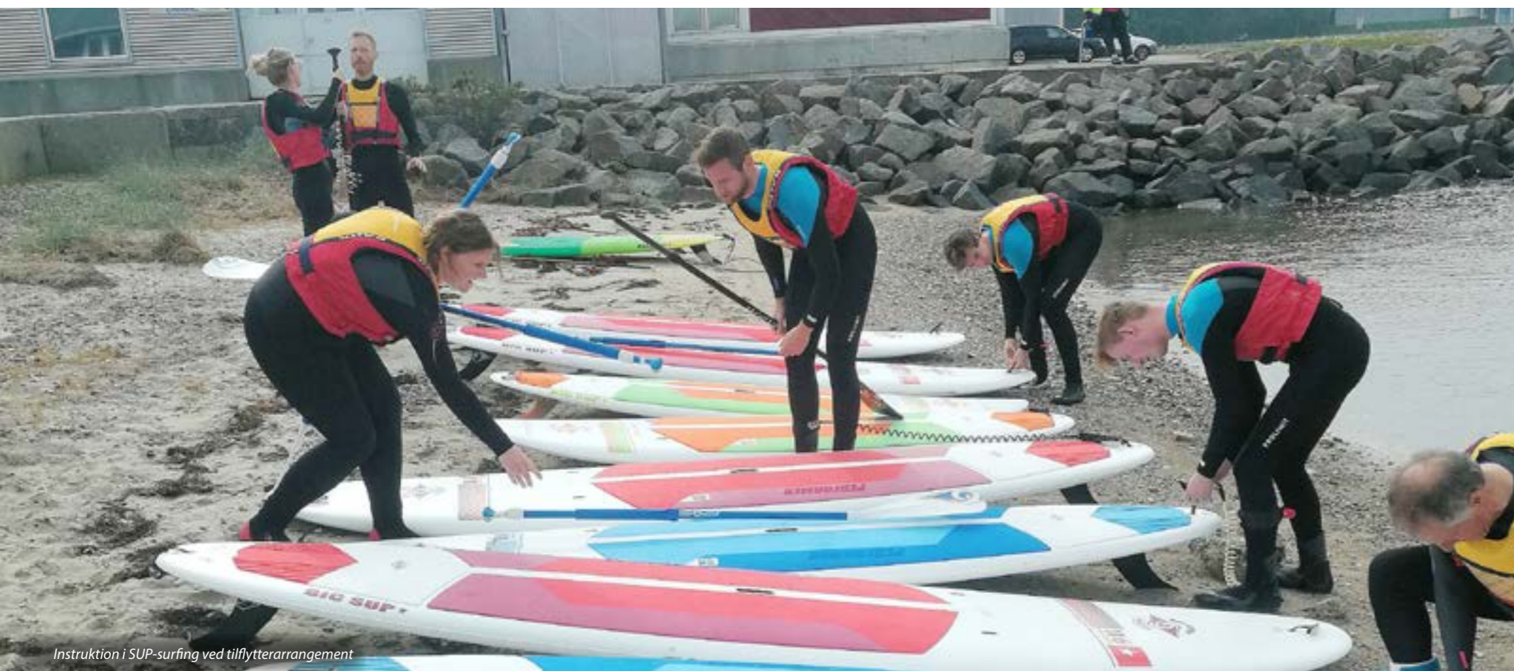
Instruktion i SUP-surfing ved tilflytterarrangement