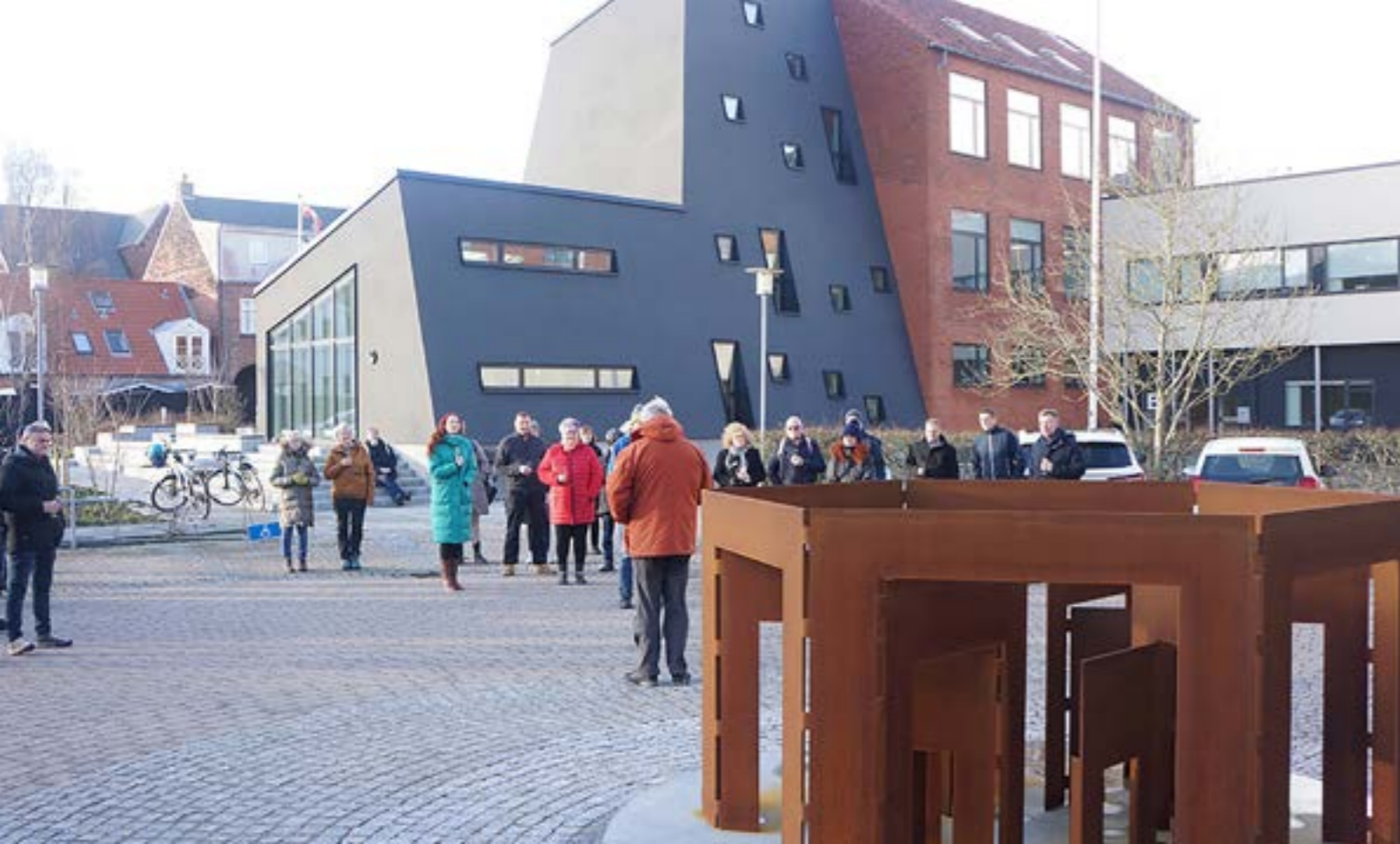
Kunstværket "Åbne Døre".