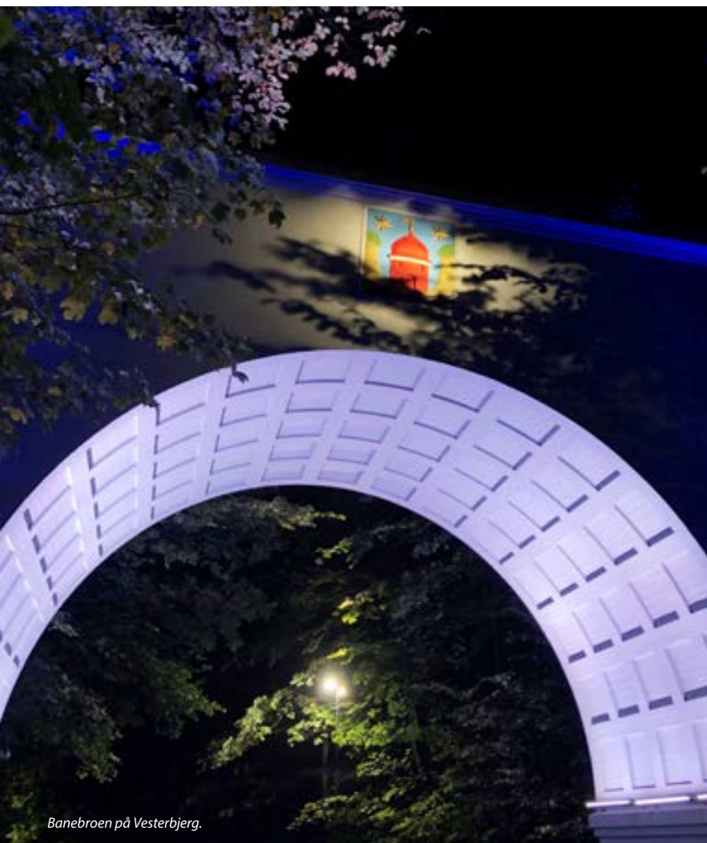
Banebroen på Vesterbjerg.