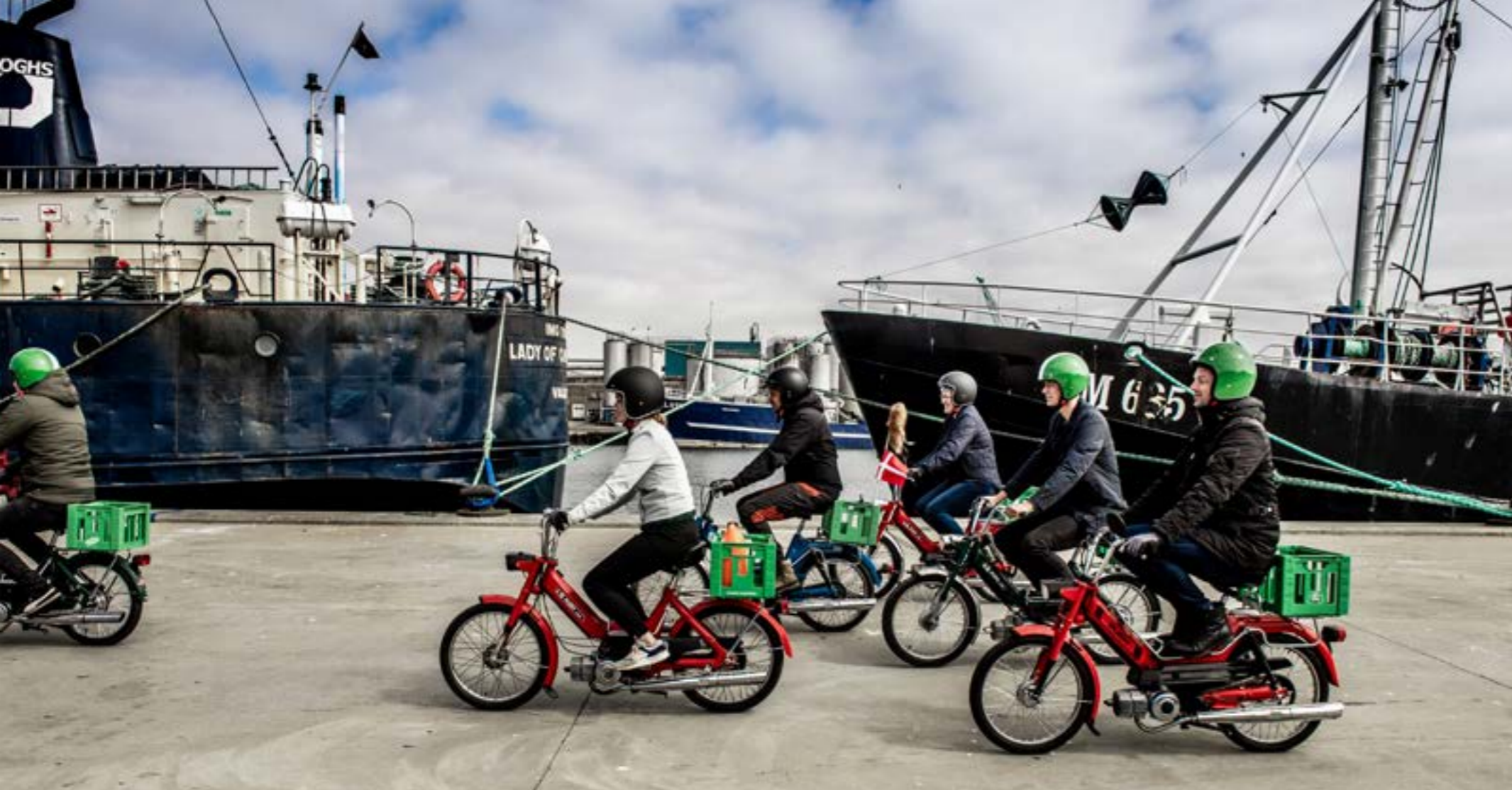
Maxitours på Thyborøn Havn.