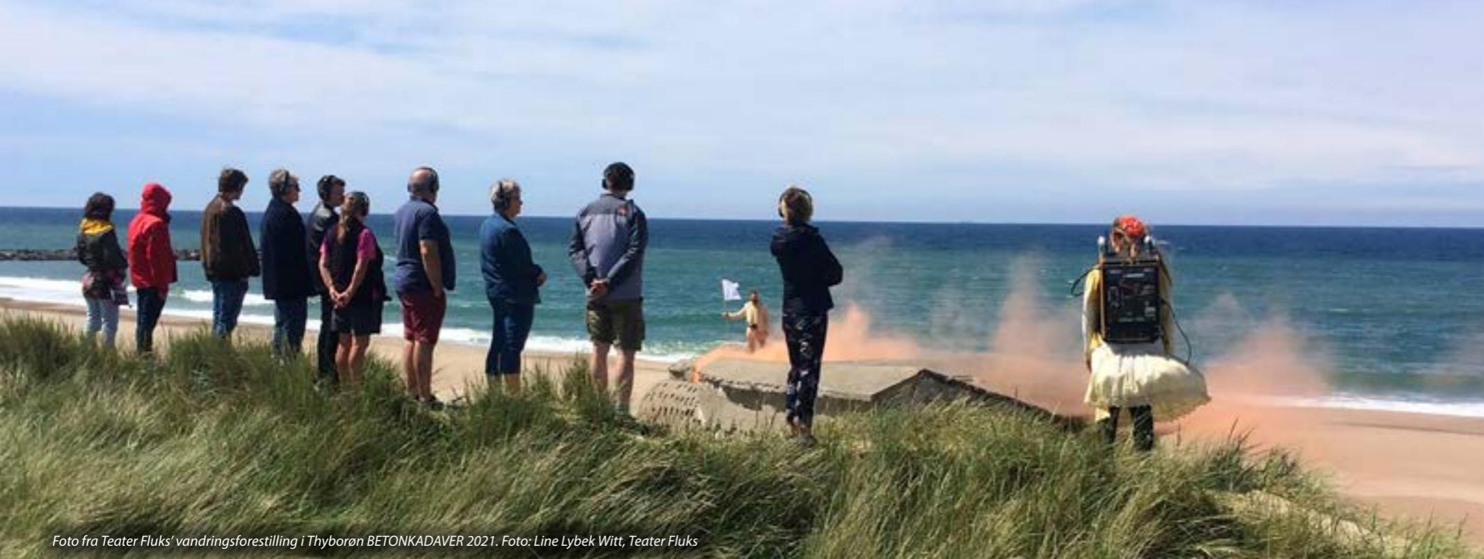
Foto fra Teater Fluks' vandringsforestilling i Thyborøn BETONKADAVER 2021.