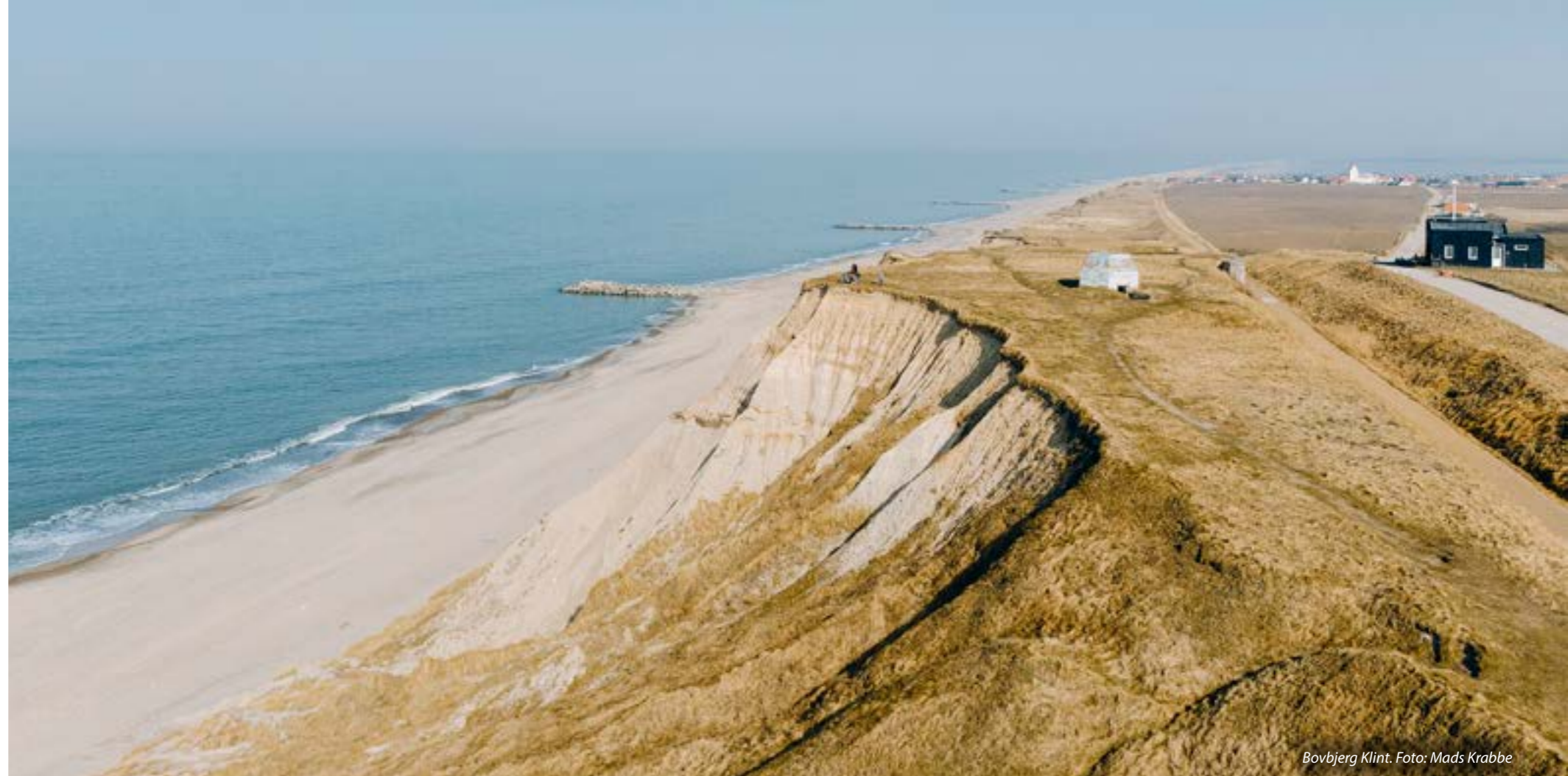
Bovbjerg Klint.

Vi vil arbejde for at imødekomme klimaudfordringen og fremme den grønne omstilling. Vi vil styrke erhvervslivets muligheder for at udnytte de naturgivne potentialer for vedvarende energi og udvikling af løsninger på klimaudfordringer. Vi vil skabe klimabevidste børn og unge.