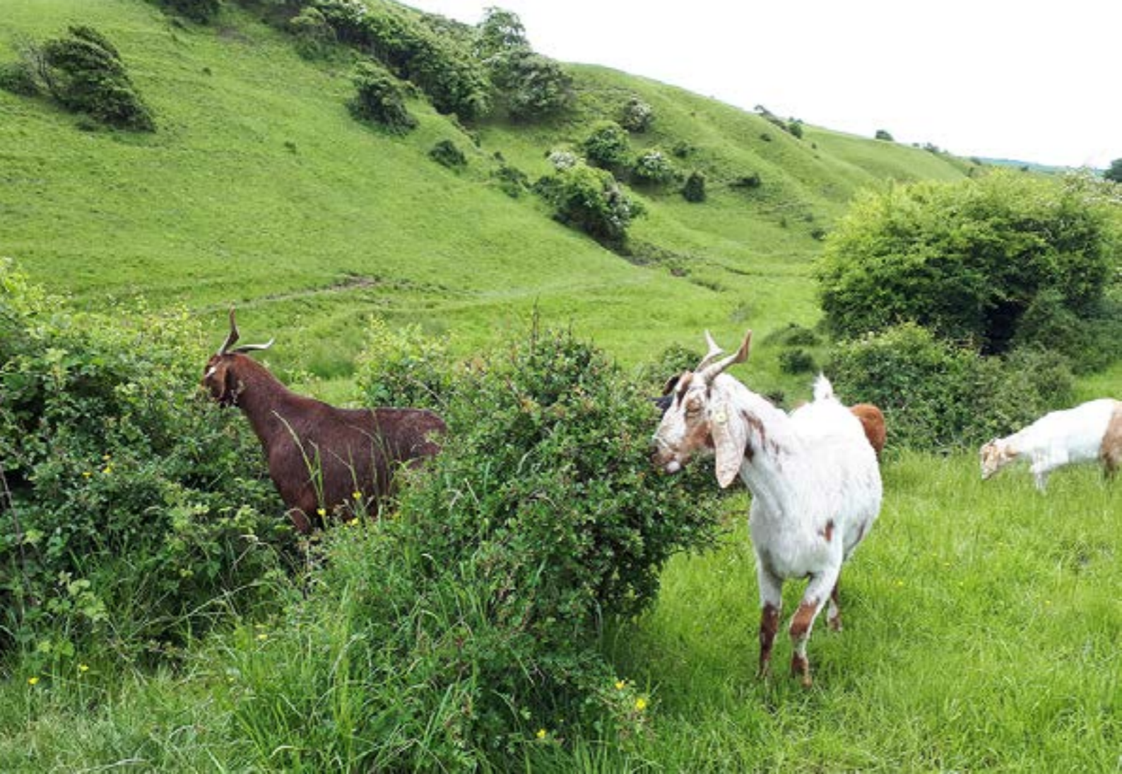
Morænelandskab ved Lemvig.