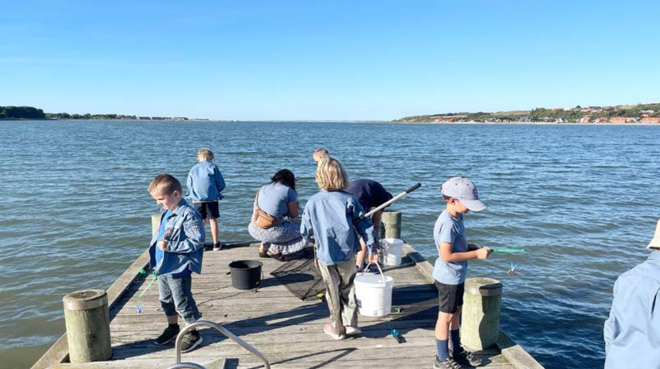
FDF Lemvig fanger krabber.