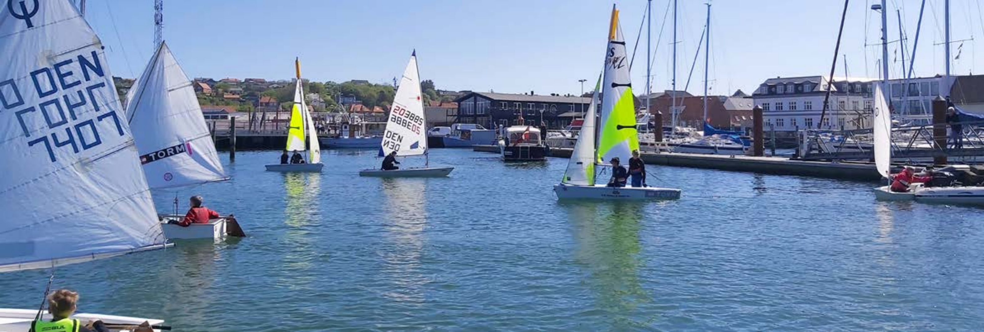
UDM for Joller 2022.