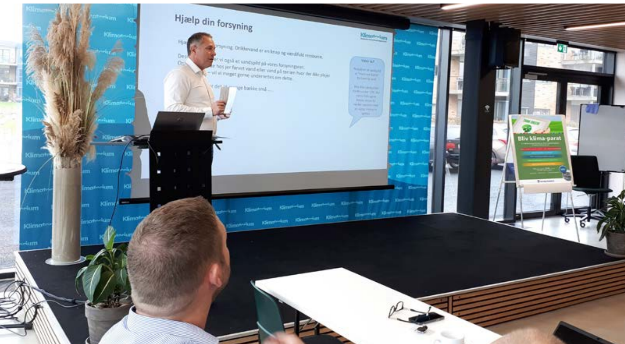
Kursusforløb for virksomheder i Lemvig Kommune.